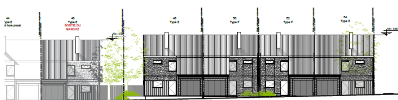
BLOC 1 - Rue Grand'Peine - Elévation Arrière